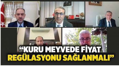
"Kuru Meyvede Fiyat Regülasyonu Sağlanmalı"

İstanbul Ticaret Borsası'nın düzenlediği "Borsa Meydanı'nda Sektörler Konuşuyor" toplantılarında bu ay kuru meyve üretimi ve ticareti ele alındı.